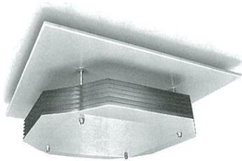
天井や壁面に設置する「フィリップス UV-C上層空気殺菌器」。専門業者が設置するので安心。電動ファンは付いておらず、動作音がないことも特長の一つだ。

UV-Cランプで35年以上の実績を持つシグニファイジャパン合同会社（旧フィリップスライティングジャパン）は、新型コロナウイルスの感染が広まった当初からUV-Cによる殺菌ランプの効果を見出し、フィリップスブランドの感染症対策製品を製造・販売している。 UV-C（紫外線C波）を用いた殺菌装置は、新型コロナウイルスを不活性化させる効果があるとして、近年様々な施設でも取り入れられるようになった。同社のフィリップスUV-Cシリーズも、米国立感染症研究所の研究により、新型コロナウイルスの99%を6秒間で不活性化することが実証されている。 一方でUV-Cが持つ強い