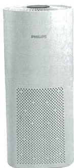
「フィリップス UV-C室内空気殺菌器」は、UV-C光が外部に漏れない設計で、24時間常時使用可能。空気清浄機と違い、フィルター掃除などのメンテナンスは不要。

バーされない方が一の場合に効果を発揮するもので、製品の落下などによりケガを負わせたり、他人の物損を壊した際に法律上の損害賠償責任を負担することによる損害に対して保険金が支払われる。現在販売されているフィリップスUV-Cシリーズの全製品が対象となっている。製品購入後、専用HPから事前のユーザー登録が必要だ。また、導入店舗にはウイルス殺菌中であることを示すステッカーも配布し、UV-Cの効果を広く周知させるとともに、感染症対策を実施している証明として利用客に安心感を与えることができる。 UV-Cは、100年以上も前から現在に至るまでテストされた全てのウイルスや細菌を不活性化させる効果があることが実証されており、今後あらゆるウイルスの脅威から身を守る上で重要な役割を果たすだろう。